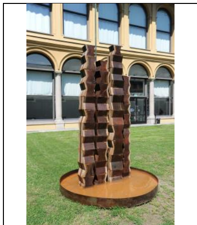
2002, Maria Cristina Carlini, Fantasmi del lago , tecnica mista su lamiera, 280 x ø 200 cm, © Mimmo Capurso