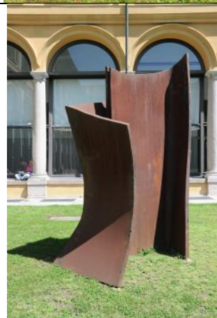
2011, Maria Cristina Carlini, Incontro , acciaio corten, 300 x 140 x 160 cm, © Mimmo Capurso