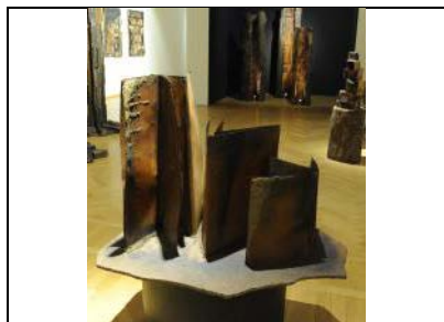
2009, Maria Cristina Carlini, Libri , ferro, tecnica mista, 75 x 100 x 70 cm, © Mimmo Capurso