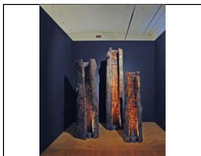
2022, Maria Cristina Carlini, Prometeo , legno di recupero, 3 elementi, 247 x ø 60 cm, 207 x ø 54 cm, 173 x ø 39 cm, © Mimmo Capurso Opera inedita