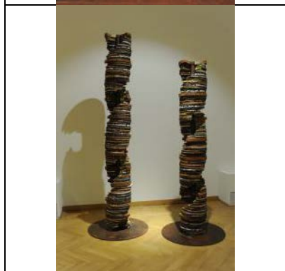
2022, Maria Cristina Carlini, Castore e Polluce , grès tecnica mista, ferro, 2 elementi, base ø 71 cm cad, 220 x ø 30 cm, 186 x ø 30 cm, © Mimmo Capurso Opera inedita