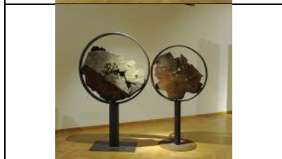
2021, Maria Cristina Carlini, Filemone e Bauci , legno di recupero, ferro, oro, 2 elementi, 204 x 80 x 50 cm, 183 x ø 71 cm, © Mimmo Capurso Opera inedita