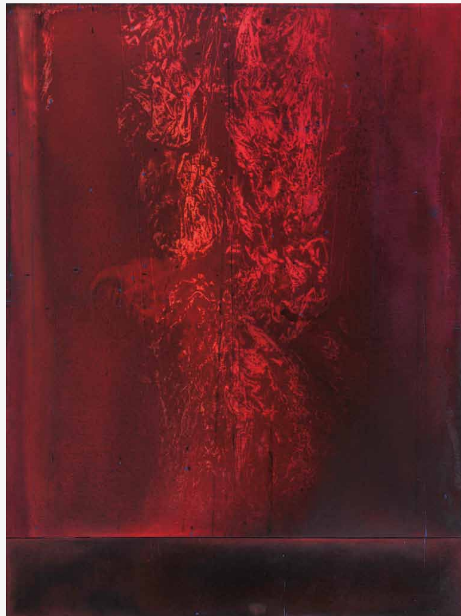
Ascesa 2012 tecnica mista su tela cm. 240 x 180