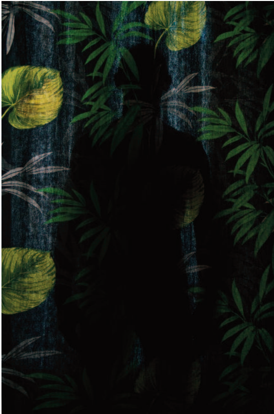
Paolo Topy, Exotica - 2014 106 X 160 cm

Via Alessandro Manzoni, 29, Milano MI, Italia | +39.02723141